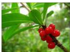
1) Волчья ягода;

16. Какая из изображенных на рисунке ягод ядовитая?